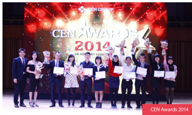
CEN Awards 2014