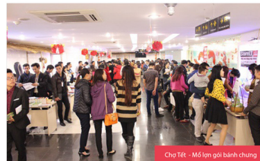
Chợ Tết - Mỏ lợn gói bánh chưng

Ngoài ra, để nâng cao chất lượng quản lý doanh nghiệp, vừa qua, phòng Nhân sự Tập đoàn cũng đã tiến hành khảo sát chất lượng sự vụ của các cấp quản lý tại CEN. Cuộc khảo sát sẽ không public thông tin cá nhân, kết quả chỉ được sử dụng với mục đích dịch chỉnh chất lượng nhân sự quản lý.