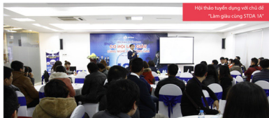
Hội thảo tuyển dụng với chủ đề "Làm giàu cùng STDA 1A"

Tiếp nối thành công từ chương trình "1000 cơ hội làm giàu cùng nghề BĐS tại CENGROUP", chiều ngày 06/02/2015 vừa qua, siêu thị dự án 1A đã tổ chức Hội thảo tuyển dụng với chủ đề "Làm giàu cùng STDA 1A" tại 137 Nguyễn Ngọc Vũ, Cầu Giấy, Hà Nội, thu hút đông đảo ứng viên. Tham dự Hội thảo, ứng viên đã được tìm hiểu về quy mô, tiềm lực của CENGROUP nói chung và STDA 1A nói riêng. Đồng thời, cũng được chia sẻ về cơ hội phát triển bản thân và "làm giàu" khi trúng tuyển.