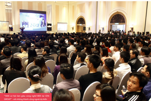
"1000 cơ hội làm giàu cùng nghề BĐS tại CEN GROUP" - với những thành công ngoài dự kiến